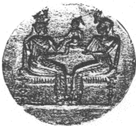
Abb. 1: Siegelringplatte: Herrscherpaar mit Kind; Gold, Berlin 1747 (aus: Priese, Das Gold von Meroe, Abb. 44)

Ungewöhnlich schien diese Macht der königlichen Frauen auch für die Schriftsteller der Antike zu sein; immer wieder äußern sie sich erstaunt darüber, daß in Meroe die „Kandaken“ herrschen. „Kandake“, von der Antike bis ins vorige Jahrhundert als Eigename meroitischer Königinnen verstanden, ist die Bezeichnung für die Mutter des Thronfolgers. Diese Frauen genossen eine vorrangige Stellung am Hof; man kann darauf schließen, daß die Königswürde