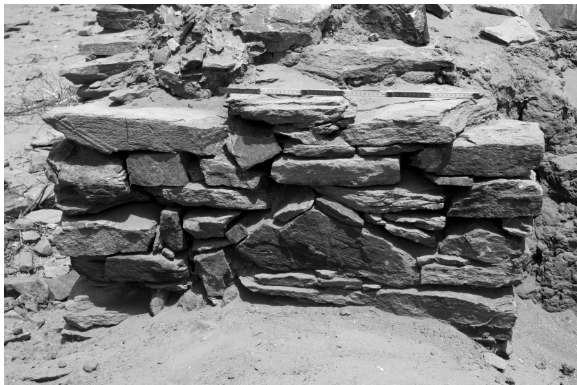
Abb. 3: Bastion 4 mit nordwestlicher Ecksituation zwischen Bastionrundung und Eingangsvorraum. Rechts schließt Ziegelmauerwerk an

Enden des Halbkreises sind so gesetzt, dass die Mauern nahezu senkrecht auf die Festungsaußenmauer weisen. Grundsätzlich unterscheidet sich diese Bastion von der Bastion 2 jedoch dadurch, dass sie von der Außenmauer der Festung soweit abgelöst ist, dass ein ca. 2,60 m breiter Raum zwischen Bastion und Festungsaußenmauer entsteht. Da von hier ein Zugang zum Festungsinnenraum besteht, werde ich den Raum im Weiteren als Torvorraum bezeichnen. Das Bruchsteinmauerwerk der äußeren Schale der Bastion ist auf beiden Seiten ca. 1,20 m in den Torvorraum geführt, so dass die Ecken mit Bruchsteinen verstärkt sind (Abb. 2 und 3). Das übrige der Festung zugewandte Mauerwerk der Bastion im Torvorraum besteht aus Lehmziegeln.