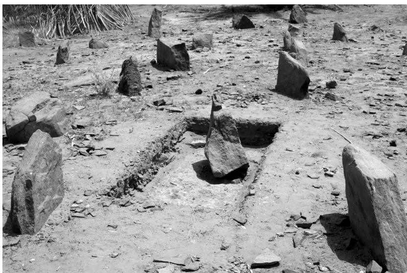
Abb. 6: Durch Fawzi H. Bakhiet freigelegter Chevaux de frise -Block

modernen Zuweg zur Festung. Auffällig ist die Häufung der Quarzsteine am nordöstlichen Ende, da in diesem Bereich auch der historische Zuweg zum Haupteingang der Festung bestanden haben muss.