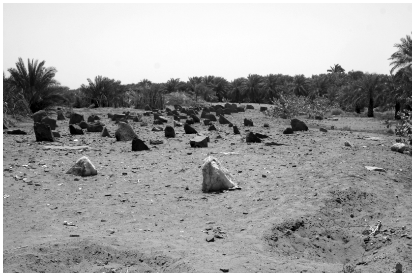
Abb. 5: Chevaux de frise , Blick Richtung Süden, im Vordergrund zwei Steine aus Quarz

Die wenigen in situ vorhandenen Quarzsteine befinden sich nur an zwei Stellen. Fünf dieser Stücke befinden sich am nordöstlichen Ende des Streifens, zwei, davon nur noch einer davon in situ, befinden sich am südöstlichen Ende des Streifens, neben dem