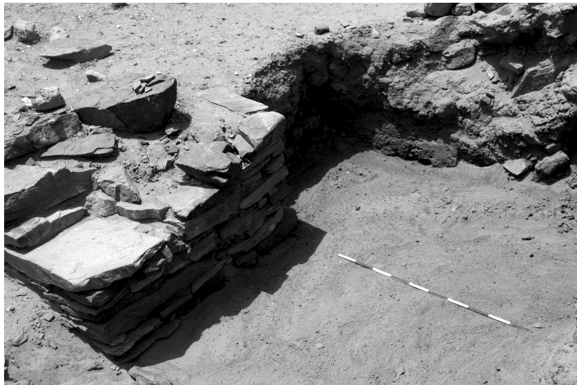
Abb. 4: Eingang 2 linker Türanschlag

Im Rahmen der Kampagne konnten insgesamt 5 Eingänge in unterschiedlichem Erhaltungszustand freigelegt werden. 5 Grundsätzlich ähneln sich die Eingänge 1, 2, 3 und 5 in ihrer Lage und Struktur. Alle vier Eingänge haben eine lichte Durchgangsbreite, die zwischen 1,25 und 1,40 m schwankt. Sie liegen jeweils zwischen der Eckbastion und der mittleren Bastion und sind nahe an die Eckbastion herangesetzt. Eingang 1 hat einen Abstand von circa 5,20 m zur