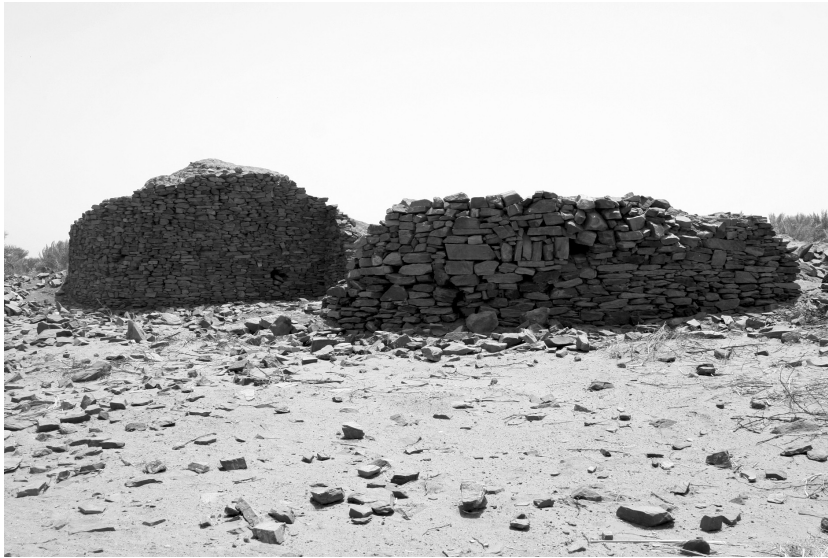
Abb. 2: Die Bastionen 3 und 4 von Nordwesten aus gesehen

Bastionen 1 und 3 sind sie jedoch in einem weiten Schwung nach innen gezogen. Zwischen den Bastionen 5 und 6 lassen die wenigen erhaltenen baulichen Strukturen auf einen relativ geraden Verlauf der Mauer schließen. Die noch vorhandenen Ansätze der Südmauern an den Bastionen 1 und 6 dagegen legen einen nach außen gewölbten Verlauf der Festungsaußenmauer nahe. Eine eventuelle Bastion in diesem Bereich wäre somit im heute hier vorhandenen Palmenhain zu suchen.