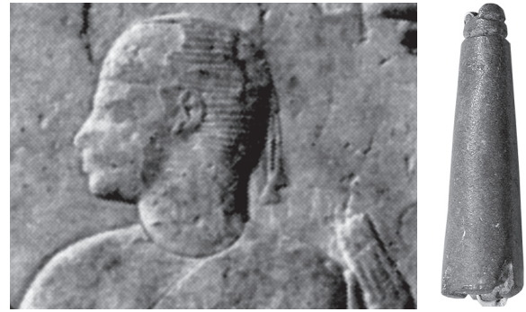
Abb. 4 Stele der Meritamun, Kairo T. 28/6/24/5 (Detail aus: Munro, P., Die spätägyptischen Totenstelen , ÄF 25, 1973, Tf. 27, Abb. 9) – Abb. 5 Blütenperle aus Stein, Ägyptisches Museum und Papyrussammlung Berlin, Inv.-Nr. 2927 (aus Grab 0714)

Die ursprüngliche Form der in Sanam belegten Perlenquasten bleibt unklar. In den Darstellungen