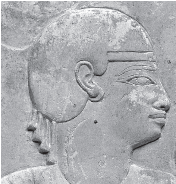
Abb. 3 Relief der Wedjarenes (?), Roemer- und Pelizaeus-Museum Hildesheim, Inv.-Nr. 5957.

herabhängende Schwänzchen ist nur bei Kuschitinnen belegt – und Tochter eines Königs. 16 Russman (1997: 33) weist außerdem auf eine Kopfstütze mit zwei Darstellungen von Kuschitinnen hin, die ebenfalls Kraushaar mit Stirnband und eine herabhängende Troddel tragen. 17 Dieser Liste kann noch eine weitere Darstellung hinzugefügt werden: Cheriru, eine in Theben bestattete Nubierin, ist auf ihrem Sarg als Kuschitin, ebenfalls mit einem Schwänzchen hinter den Beinen, wiedergegeben. 18 Nicht nur ihre Kleidung, auch die dunkle Gesichtsfarbe und das Kraushaar weisen sie eindeutig als Südländerin aus. Bei einer Darstellung ist zwar das Gesicht zerstört, der Hinterkopf mit zwei fein gemalten Quasten aber noch zu erkennen. So dürfte auch sie mit dem Stirnband und den Troddeln gezeigt worden sein. 19