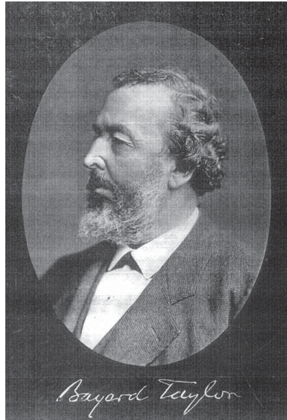
Abb. 1: Bayard Taylor

Nach einer abgebrochenen Buchdruckerlehre kann der neunzehnjährige Taylor als Zeitungskorrespondent für fast zwei Jahre nach Europa reisen. Er besucht Belgien, England, Frankreich, Italien und bleibt mehr als ein halbes Jahr in Deutschland. Beide Großmütter von Taylor stammen aus Süddeutschland und so fühlt er sich zu Deutschland hingezogen – so sehr, dass es ihm später zu einer zweiten Heimat wird. In dieser Zeit sendet er immer wieder Reiseberichte an die Zeitung, die nach seiner Rückkehr gesammelt als Buch unter dem Titel „Views A-Foot; or Europe seen with Knapsack and Staff“ erscheinen.