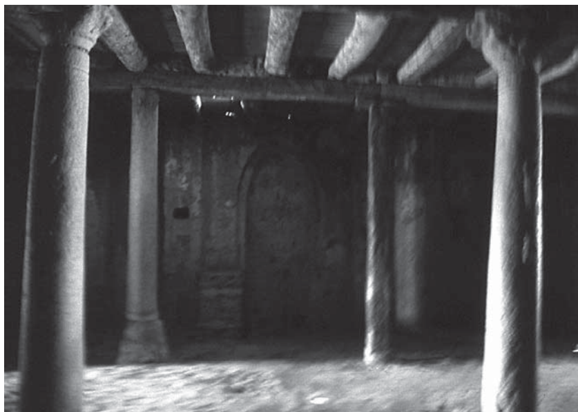
Abb. 6: Der Thronraum im Königspalast on Old Dongola

santeres Gebäude, als man an einer solchen Stätte zu finden erwarten sollte. In der Nähe des Thores ist ein gewölbter Gang, der nach einigen unterirdischen Gemächern führt, die ich nicht untersucht habe. Es bedurfte indeß etwas mehr als der Versicherung eines alten Nubiens, um mich zu überzeugen, daß ein unterirdischer Gang von dieser Stelle nach dem Dschebel Barkal gehe. Eine große steinerne Treppe führte in das zweite Geschoß, in dem es viele Gemächer und Gänge gab. ... Der Audienzsaal war einst mit Marmor gepflastert, von dem noch einige Blöcke da liegen, und die Decke wird in der Mitte von drei Granitsäulen getragen, die aus einer altägyptischen Ruine genommen sind. 20 Der hier erwähnte unterirdische Gang zum Gebel Barkal ist ein Thema, das in nubischen Märchen bis heute noch tradiert wird. Dieser Gang ist auch in den Erzählungen am anderen Ende, am Gebel Barkal, zu finden. In einer davon heißt es, dass eine Kuh im B 300 verschwunden sei und dann in Alt-Dongola wieder herausgekommen sei, wobei ihr Fell jedoch von den Felsen im Untergrund abgeschabt wurde und sie nackt erschien. 21