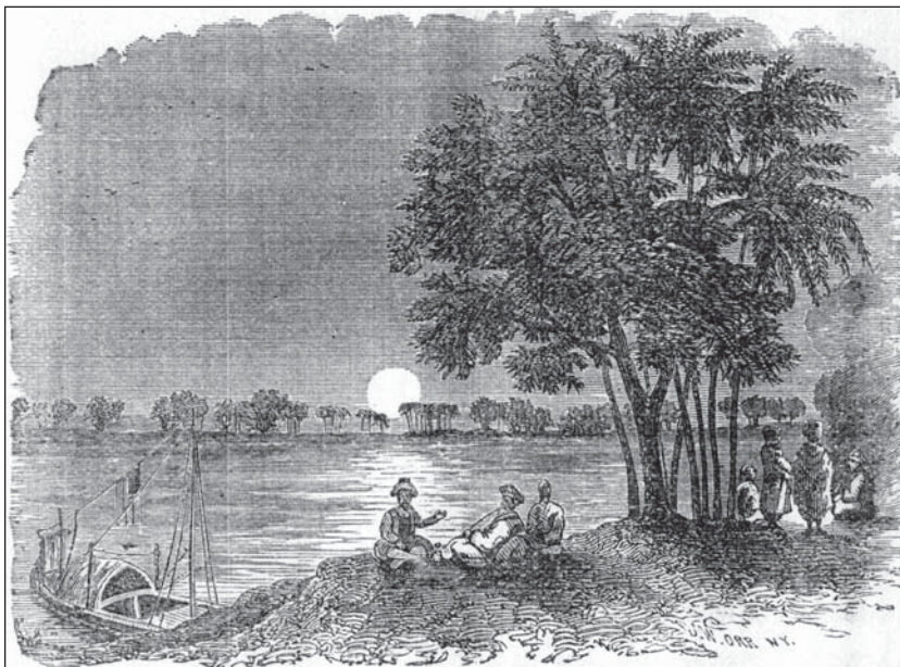
Abb. 2: „Moonlight on the Ethiopian Nile“ (Taylor 1854: 238)

Das Interesse an den Altertümern ist für die Taylor begleitenden Nubier unbegreiflich: „Mein Rais, der den Zweck