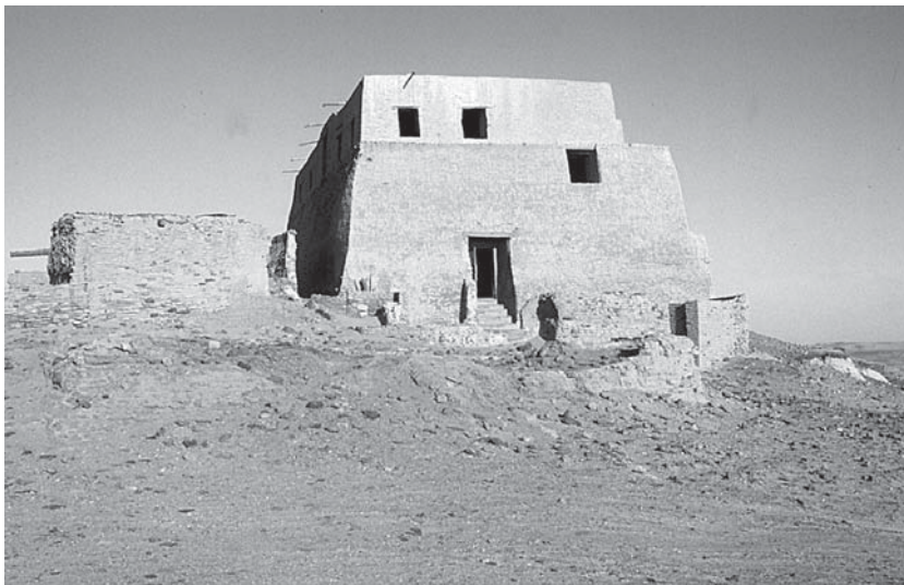
Abb. 5: Der Königspalast von Old Dongola.

santeres Gebäude, als man an einer solchen Stätte zu finden erwarten sollte. In der Nähe des Thores ist ein gewölbter Gang, der nach einigen unterirdischen Gemächern führt, die ich nicht untersucht habe. Es bedurfte indeß etwas mehr als der Versicherung eines alten Nubiens, um mich zu überzeugen, daß ein unterirdischer Gang von dieser Stelle nach dem Dschebel Barkal gehe. Eine große steinerne Treppe führte in das zweite Geschoß, in dem es viele Gemächer und Gänge gab. ... Der Audienzsaal war einst mit Marmor gepflastert, von dem noch einige Blöcke da liegen, und die Decke wird in der Mitte von drei Granitsäulen getragen, die aus einer altägyptischen Ruine genommen sind. 20 Der hier erwähnte unterirdische Gang zum Gebel Barkal ist ein Thema, das in nubischen Märchen bis heute noch tradiert wird. Dieser Gang ist auch in den Erzählungen am anderen Ende, am Gebel Barkal, zu finden. In einer davon heißt es, dass eine Kuh im B 300 verschwunden sei und dann in Alt-Dongola wieder herausgekommen sei, wobei ihr Fell jedoch von den Felsen im Untergrund abgeschabt wurde und sie nackt erschien. 21