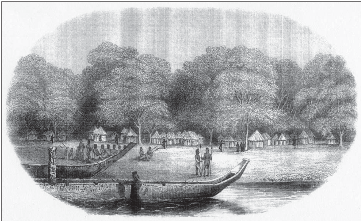
Abb. 3: "Aba, Village of the Shillook Negroes (the turning point)" (Taylor 1854: Frontispiz)

meines Besuches nicht begreifen konnte, sprach von Lepsius als einem großen fränkischen Astrologen, der Hunderte von Leuten viele Tage lang beschäftigt und zuletzt in der Erde eine Menge Hühner und Tauben, alle von purem Gold, gefunden habe. Er habe dann den Leuten einen guten Backschisch gegeben, sei weiter gezogen und habe die goldenen Vögel mit sich genommen. ... Der Rais und die Matrosen wussten nicht recht, was sie aus meinem Besuch des Ortes machen sollten, sie schlossen aber endlich, daß ich einige der goldenen Tauben zu finden hoffte, die der fränkische Astrolog noch nicht mitgenommen habe. 15