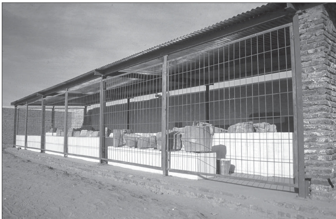
Das im Frühjahr 2001 errichtete Open Air Museum in der Großen Anlage von Musawwarat es Sufra