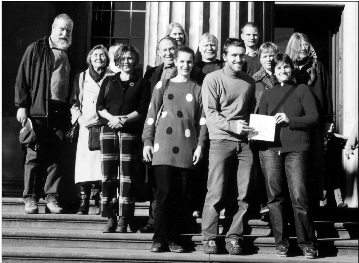
Abb. 1: Die Exkursionsteilnehmer vor dem British Museum.