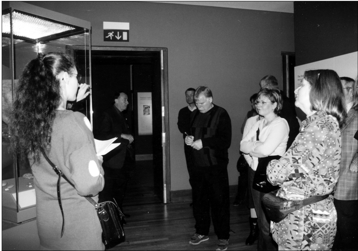
Abb. 2: In der Sonderausstellung „Sudan: Ancient Treasures“.

genutzte Granitstele des Königs Schabaqo, der den Text eines alten Papyrus vor der Zerstörung bewahren wollte und auf diese Stele übertragen ließ. Dieser Text, als „memphitische Theologie“ bezeichnet, beinhaltet mythologische Themen und enthält u.a. Passagen aus den Götterlegenden von Osiris und Horus.