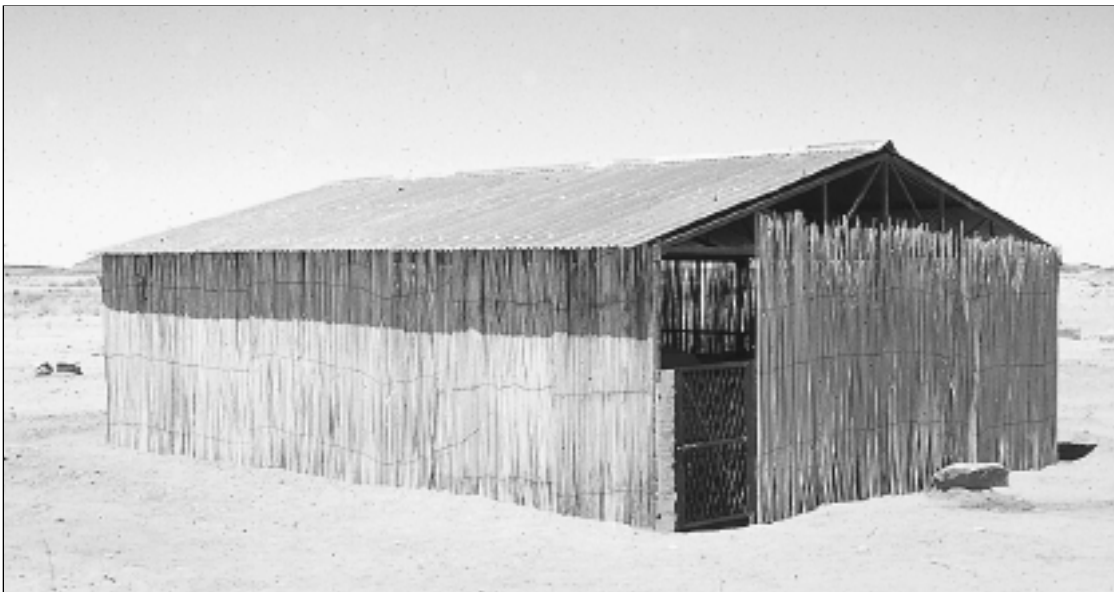
Schutzkonstruktion um den Sebiomeker-Tempel (II A)

Durch neue Mitglieder und Sponsoren werden wir weiter vorankommen, besonders durch jene, die selbst bei den Rettungs- und Schutzmaßnahmen mit Hand anlegen. Gemeinsam läßt sich viel erreichen. Die Anfänge sind hoffnungsvoll. ●