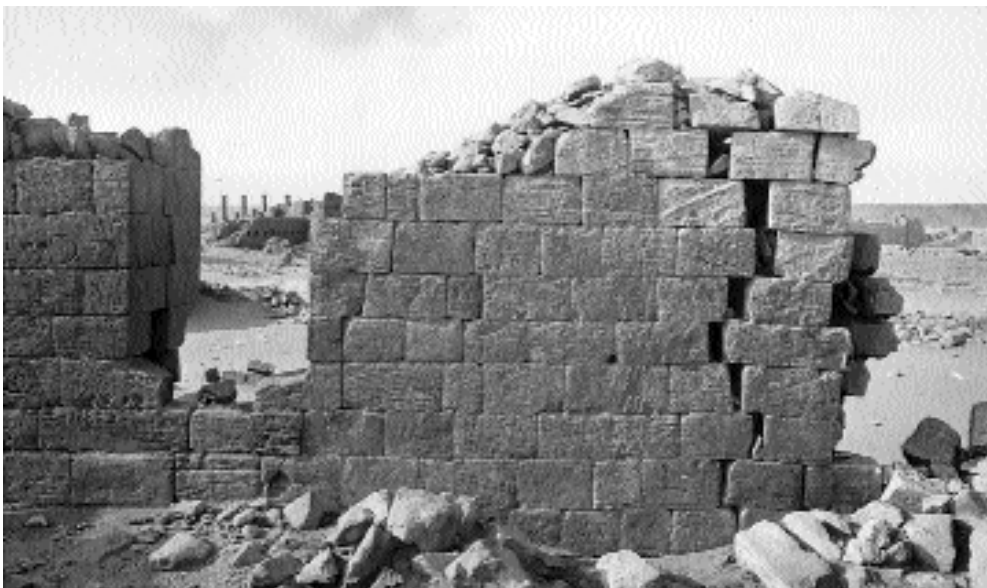
Musawwarat, Große Anlage: Meßbild einer gefährdeten Mauer

Büro Berlin Hohefeldstr. 41 13467 Berlin Tel.: (030)