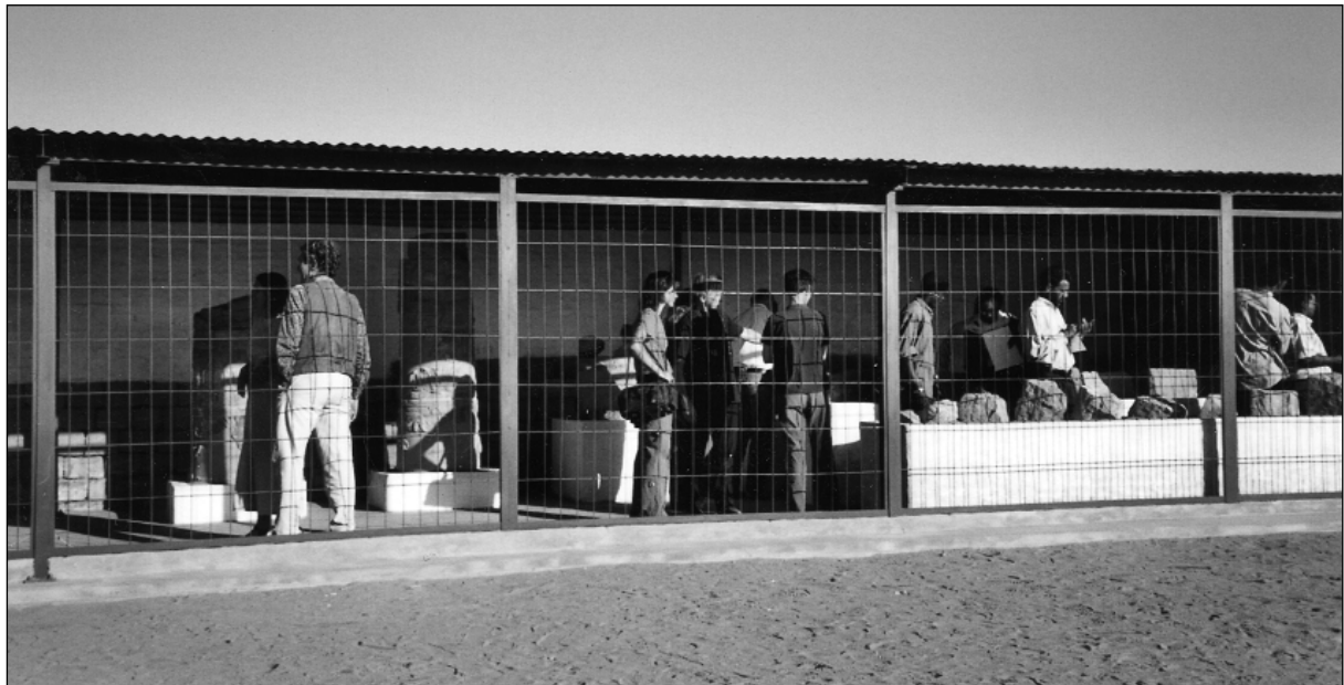
Abb. 9: Der Südflügel des neu eröffneten Musawwarat Museums.