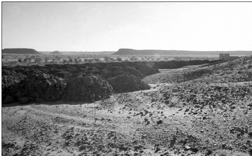
Abb. 12: SCI-Arbeiten. Abraumbalden mit Hafirschlamm.

B. Vogt hat damit begonnen, das Grabungshaus erweitern zu lassen. Es wurde Mitte März damit begonnen, einen Komplex bestehend aus zwei Räumen für jeweils 2 Personen zu bauen. Damit wird ein kleiner Innenhof geschaffen, der zukünftig begrünt werden soll. Die Bauarbeiten wurden nach Abreise der Mission beendet. Im folgenden Jahr sollen nochmals zwei Räume im Süden angefügt werden, so dass die Arbeits- und Lebensbedingungen der Mitarbeiter wesentlich verbessert werden und zukünftig keine Unterbringung in Zelten mehr notwendig sein wird.