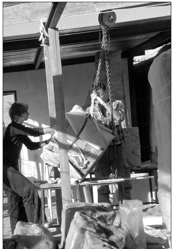
Abb. 5: Eine Säulentrommel wird von den Restauratoren mit dem Flaschenzug vorsichtig vom Arbeitstisch gehoben (Foto: St. Wenig).

Die Aufstellung der Säulen mit drei bzw. zwei Trommeln aus Raum 516 der GA gestaltete sich kompliziert. Die einzelnen Säulentrommeln wogen bis zu 350 kg. Da sie „kopfüber“ auf Arbeitstischen restauriert wurden, mußten sie zur Aufstellung gedreht, seitlich bewegt und schließlich gehoben werden. Es war nicht möglich, einen Kran zu beschaffen. So mußten die Arbeiten mit Hilfe eines Flaschenzuges durchgeführt werden (Abb. 5 und 6). Dazu war es notwendig, die Wellblechabdeckung des Daches teilweise zu entfernen, dort den Flaschenzug anzubringen (mit Abstützung der Konstruktion) und den Flaschenzug ständig zu bewegen bzw. schließlich höher zu legen. Hier hat vor allem R. Lobban wertvolle Hilfe geleistet, der Erfahrungen mit solchen Arbeiten besass. Die Aufstellung ist ausführlich dokumentiert worden. Auf den zusammengesetzten Säulentrommeln befinden sich jeweils lose Fragmente einer darüber liegenden 3. bzw. 4. Trommel.