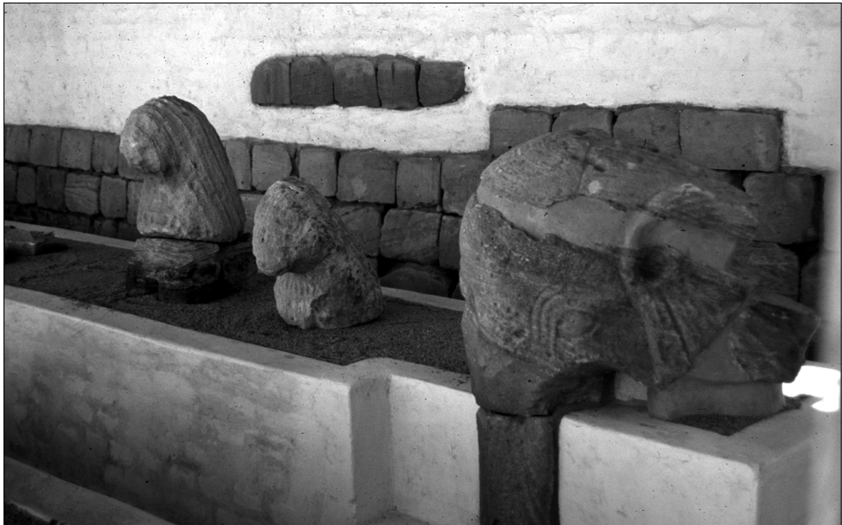
Abb. 3: Nordflügel des Museums. Die Elefantenverzierung vom Pronaos des Tempels 300, daneben die Oberteile der beiden Löwenplastiken, die einst am Beginn des Aufweges zum Tempel 300 standen.

Tür, 17) die Absenkung von zwei Podesten für die Aufnahme der restaurierten Säulen. Außerdem mußten Tür, Fenster und Teile der Eisenkonstruktion neu gestrichen werden. Darüber hinaus wurden die Wände des Wächterraumes innen und außen sowie die südliche Wand des Südflügels innen und außen neu gestrichen (sandfarben anstelle von weiß). Der Gesamteindruck des Museums hat sich dadurch wesentlich verbessert.