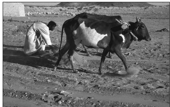
Abb.10: Mit einem Rindergespann wird der Abraumhügel im Nordostzwickel außerhalb der Großen Anlage abgetragen.

Mehrere Männer sortierten die Steine per Hand, verbrachten den Steinschutt auf eine neue Halde im Osten der GA, während der Sand in Richtung Wadi gezogen werden konnte. Hier kann in Zukunft der offizielle Parkplatz angelegt werden. Die Steinhalde soll in der nächsten Kampagne beseitigt werden.