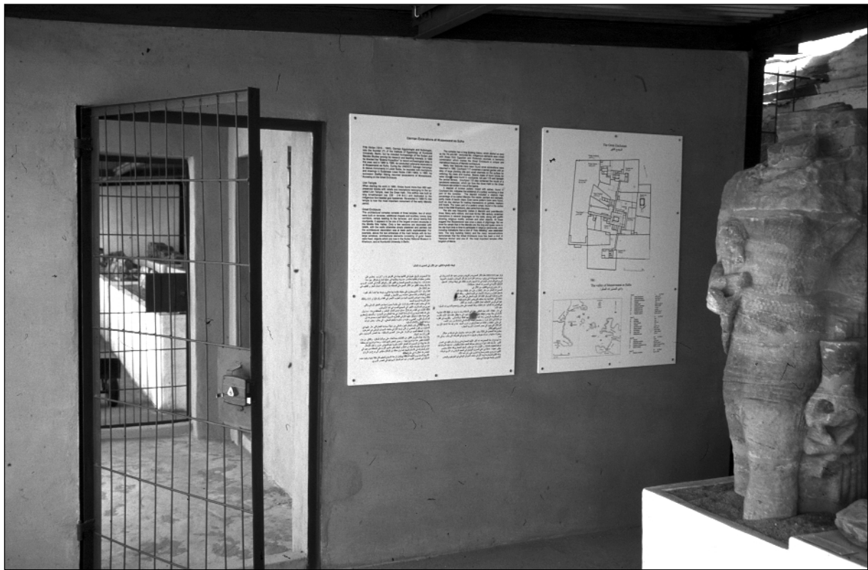
Abb. 2: An der Nordwand des Südflügels sind zwei großformatige Informationstexte der SAG angebracht.