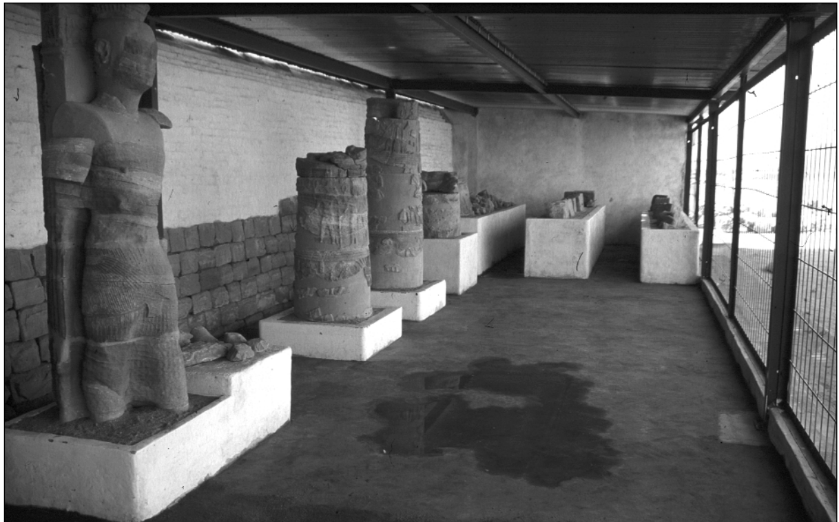
Abb. 4: Blick in den Südflügel des Musawwarat Museums kurz vor der Eröffnung. Links im Bild die Säulenstatue des Sebiumecker.

Tempel 300 sowie Blöcke mit Kalkputz aus den frühen Bauperioden) und Plastiken, u.a. die Löwenfiguren vom Aufweg am Tempel 300, der Elefantenkopf vom Tempel 300 u.a.