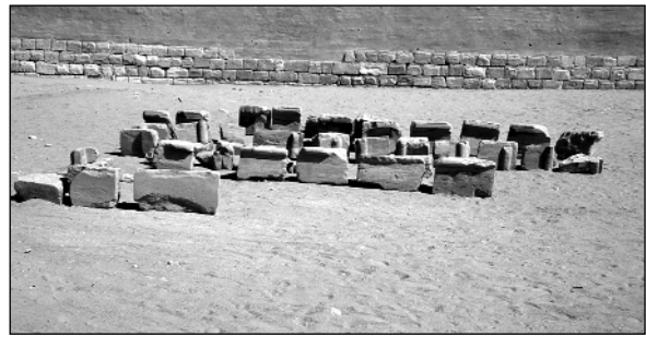
Abb.11: Neu geordnete Architekturteile des Tempels 300, abgelegt im Hof 227 der Großen Anlage.

Der Verputz der wieder aufgebauten Umfassungsmauer war notwendig geworden, da die Fugen der in den Jahren 1997 - 1998 aufgebaute Teile z.T. ausgeblasen und die Aufmauerung durch unterschiedliche Fugung in den einzelnen Jahren einen wenig