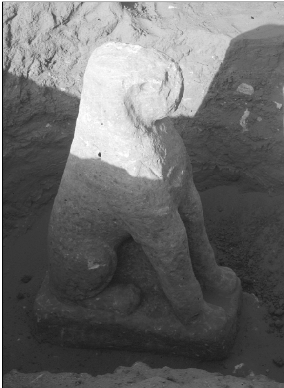
Abb. 1: Der bereits von F. Hintze gefundene sitzende Löwe aus hartem Sandstein nach seiner Wiederfreilegung.

Bei einer Wasserprobe stellte sich z.B. heraus, dass selbst geringer Wind ausreicht, um das aus den Speiern abfließende Wasser gegen die Wände zu drücken. Es wird darüber diskutiert, ein neues Ableitsystem zu schaffen, um diese Schadensursache auf Dauer auszuschalten.