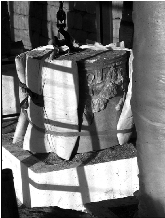
Abb. 6: Die erste Säulentrommel, sorgfältig eingepackt, um die Reliefs nicht zu beschädigen, sitzt auf dem Kiesbett des Podestes.