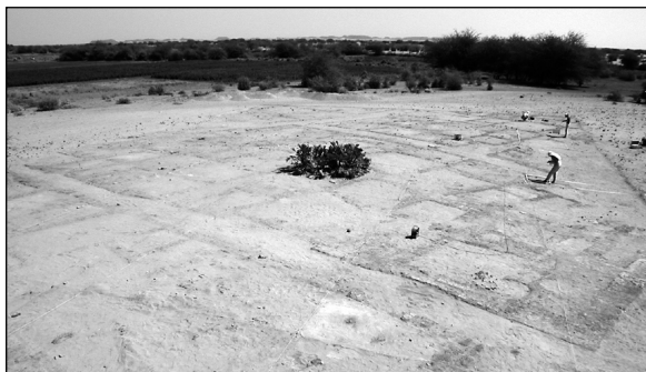
Abb. 2: Überblick über die freigelegten Siedlungsreste.

Etwa 1400 m 2 der untersuchten Fläche zeigten die fast vollständig erhaltenen Hausgrundrisse einer dichten Bebauung (Abb. 1-2, Farbabb. 4). Dabei befanden sich nicht nur die Mauern und Ziegel in einem sehr guten Erhaltungszustand. Selbst Details wie der Farbe tragende Lehmverputz waren noch vorhanden. Das Gebiet beherbergt vier annähernd rechtwinklig angelegte Gebäudeblocks, die voneinander durch enge Straßen von etwa 1 m Breite gegliedert sind. Die generelle Orientierung der Bauten entspricht derjenigen des Tempels H 1000. Der mittlere Block H 1200 bedeckt eine Fläche von rund 450 m 2 und hat ein Maßverhältnis von annähernd 1:2. 3) Vorspringende Mauerecken an einigen Außenmauern sowie der teilweise gewundene Verlauf der Straßen lassen es möglich erscheinen, dass die Bauten ursprünglich kleiner und planmäßiger angelegt waren und durch spätere