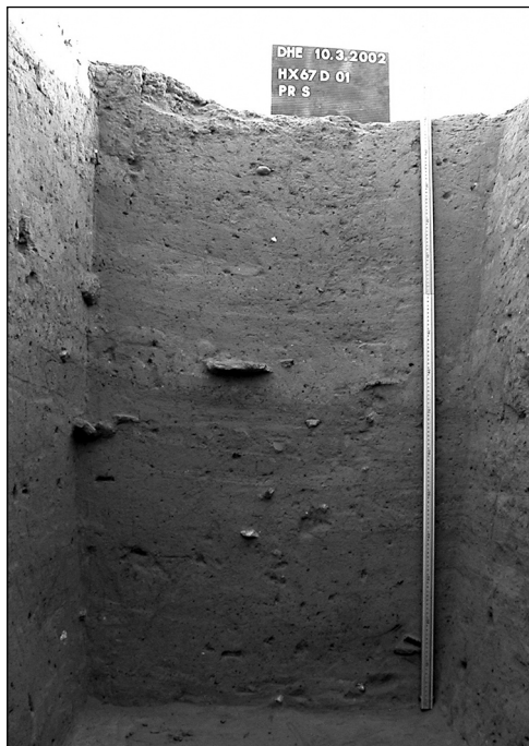
Abb. 10: Testschnitt HX67D-1, Süd-Profil.

Die verhältnismäßig klare Stratigraphie in den Testschnitten zeigt, dass Hamadab während einer längeren Periode besiedelt war. Das Vorhandensein von gestempelter meroitischer Feinware in allen archäologischen Horizonten weist sie der klassischen bis spätmeroitischen Epoche zu.