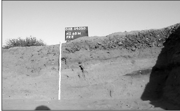
Abb. 11: Schnitt HZ65M im Schlackehügel, Ost-Profil.

20 m nördlich des Schlackehügels, eine runde dunkle Struktur von etwa 2,5 m Durchmesser. Es ist nicht ausgeschlossen, dass es sich dabei um die Reste eines Verhüttungsofens handelt.