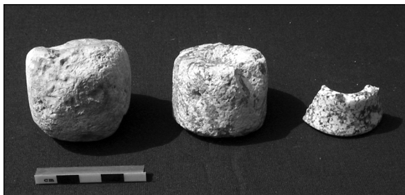
Abb. 8: Daumenringe von Bogenschützen, links zwei Roblinge.