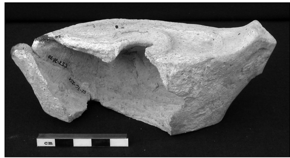
Abb. 3: Öllampe (Fund-Nr. 2002-FC-25).