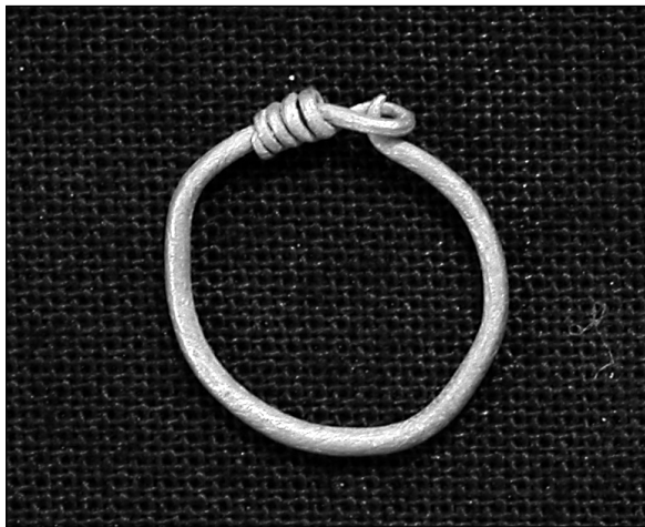
Abb. 6: Obrring, Gold (Fund-Nr. 2002-FC-57, Durchmesser ca. 1,2 cm).