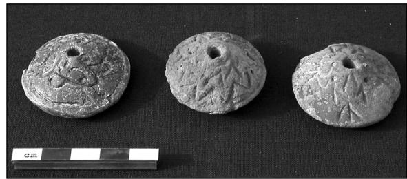
Abb. 4: Spinnwirtel, gebrannter Ton (Fund-Nr. 2002-FC-43, -46 und -47).