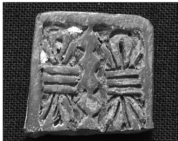
Abb. 5: Fragment eines Sa-Amunletts, gebrannter Ton (Fund-Nr. 2002-FC-59, ca. 2x2 cm).

interessant, dass die Bauten und ihre Anordnung auf dem Nordhügel durchaus mit der Struktur römischer castra in Ägypten und im Vorderen Orient vergleichbar sind. 13) Auch Befunde wie beispielsweise die Eisenschlackehügel können mit Militärlagern in Zusammenhang gebracht werden. 14) Militärcamps hat es im meroitischen Sudan gegeben, obgleich noch keines von ihnen genauer archäologisch untersucht wurde. 15)