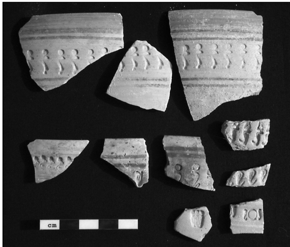
Abb. 7: Mit verschiedenen Uränenmustern verzierte Scherben.