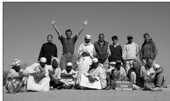
Das Team der Kampagne 2002.

Die großflächigen surface clearings der diesjährigen Kampagne veranschaulichen das Nebeneinander von Wohnbauten, Tempel, Stadtmauer und Produktionsstätten - Strukturen einer meroitischen Stadtsiedlung im Herzen des Reiches, wie sie vorher nicht bekannt waren. Dabei lassen sich die Befunde und Funde, die in Hamadab in einem hervorragend gutem Zustand erhalten sind, direkt mit der Situation in der benachbarten Hauptstadt vergleichen. Deshalb wird Hamadab auch in Zukunft sehr interessante Ergebnisse für die Erforschung der sozialen, ökonomischen und kulturellen Verhältnisse in der meroitischen Gesellschaft liefern, insbesondere weil es sich bei Hamadab um eine nicht-königliche Stadtsiedlung zu handeln scheint. Die Halden und Produktionsgebiete am Rande der Siedlung werden hoffentlich neue Hinweise auf antike Technologien und Produktionsmethoden liefern. Die Aufgabe der nächsten Kampagne wird aber zunächst einmal sein, durch die Verfolgung der Mauer hinter dem Tempel H 1000 das eigentliche Stadtgebiet genauer einzuzugrenzen.