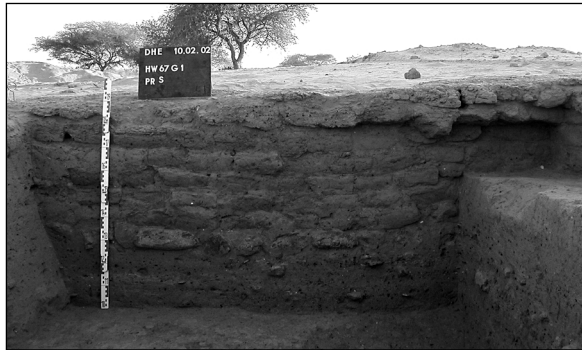
Abb. 9: Testschnitt HW67G-1, Süd-Profil.

C: Darunter setzen sich in diesem Schnitt abwechselnde, lehmig-sandige Schichten fort, die neben Fragmenten gebrannter Ziegel, Holzkohle und Knochenresten, auch bemalte und gestempelte Feinware enthalten (z.B. Fund-Nr. 02-CB-08.01). Das "Hochziehen" der Schichten an den Schnittträndern zeigt, dass auch in dieser Tiefe eine Straße vorhanden war (Abb. 10). Das untere Ende dieser Schichten wurde in dem 1,8 m tiefen Schnitt noch nicht erreicht.