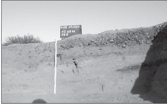
Abb. 11: Schnitt HZ65M im Schlackehügel, Ost-Profil.

20 m nördlich des Schlackehügels, eine runde dunkle Struktur von etwa 2,5 m Durchmesser. Es ist nicht ausgeschlossen, dass es sich dabei um die Reste eines Verhüttungsofens handelt.