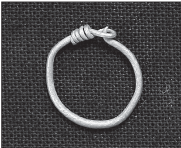
Abb. 6: Obrring, Gold (Fund-Nr. 2002-FC-57, Durchmesser ca. 1,2 cm).