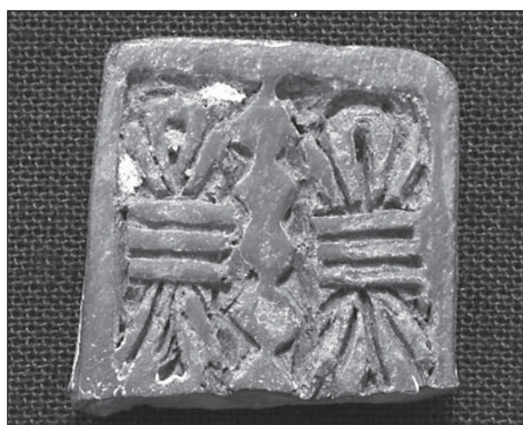
Abb. 5: Fragment eines Sa-Amunletts, gebrannter Ton (Fund-Nr. 2002-FC-59, ca. 2x2 cm).

interessant, dass die Bauten und ihre Anordnung auf dem Nordhügel durchaus mit der Struktur römischer castra in Ägypten und im Vorderen Orient vergleichbar sind. 13) Auch Befunde wie beispielsweise die Eisenschlackehügel können mit Militärlagern in Zusammenhang gebracht werden. 14) Militärcamps hat es im meroitischen Sudan gegeben, obgleich noch keines von ihnen genauer archäologisch untersucht wurde. 15)