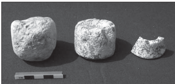
Abb. 8: Daumenringe von Bogenschützen, links zwei Roblinge.