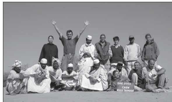
Das Team der Kampagne 2002.

Die großflächigen surface clearings der diesjährigen Kampagne veranschaulichen das Nebeneinander von Wohnbauten, Tempel, Stadtmauer und Produktionsstätten - Strukturen einer meroitischen Stadtsiedlung im Herzen des Reiches, wie sie vorher nicht bekannt waren. Dabei lassen sich die Befunde und Funde, die in Hamadab in einem hervorragend gutem Zustand erhalten sind, direkt mit der Situation in der benachbarten Hauptstadt vergleichen. Deshalb wird Hamadab auch in Zukunft sehr interessante Ergebnisse für die Erforschung der sozialen, ökonomischen und kulturellen Verhältnisse in der meroitischen Gesellschaft liefern, insbesondere weil es sich bei Hamadab um eine nicht-königliche Stadtsiedlung zu handeln scheint. Die Halden und Produktionsgebiete am Rande der Siedlung werden hoffentlich neue Hinweise auf antike Technologien und Produktionsmethoden liefern. Die Aufgabe der nächsten Kampagne wird aber zunächst einmal sein, durch die Verfolgung der Mauer hinter dem Tempel H 1000 das eigentliche Stadtgebiet genauer einzuzugrenzen.