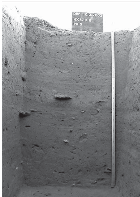
Abb. 10: Testschnitt HX67D-1, Süd-Profil.

Die verhältnismäßig klare Stratigraphie in den Testschnitten zeigt, dass Hamadab während einer längeren Periode besiedelt war. Das Vorhandensein von gestempelter meroitischer Feinware in allen archäologischen Horizonten weist sie der klassischen bis spätmeroitischen Epoche zu.