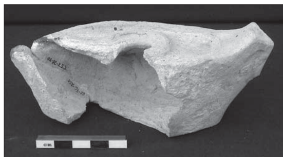
Abb. 3: Öllampe (Fund-Nr. 2002-FC-25).