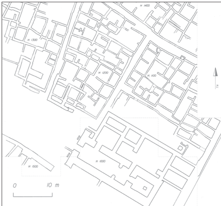
Abb. 1: Plan der Oberflächensondagen.