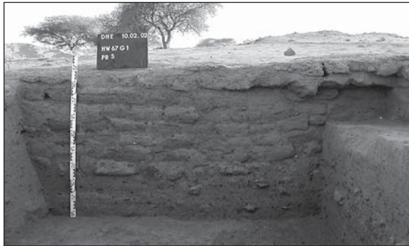
Abb. 9: Testschnitt HW67G-1, Süd-Profil.

C: Darunter setzen sich in diesem Schnitt abwechselnde, lehmig-sandige Schichten fort, die neben Fragmenten gebrannter Ziegel, Holzkohle und Knochenresten, auch bemalte und gestempelte Feinware enthalten (z.B. Fund-Nr. 02-CB-08.01). Das "Hochziehen" der Schichten an den Schnittträndern zeigt, dass auch in dieser Tiefe eine Straße vorhanden war (Abb. 10). Das untere Ende dieser Schichten wurde in dem 1,8 m tiefen Schnitt noch nicht erreicht.