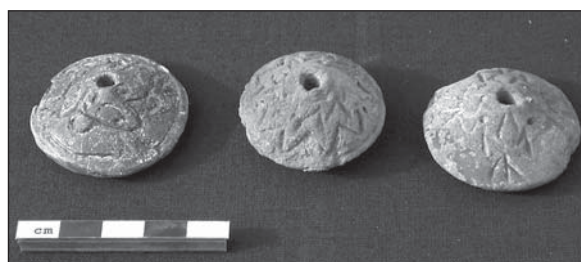
Abb. 4: Spinnwirtel, gebrannter Ton (Fund-Nr. 2002-FC-43, -46 und -47).