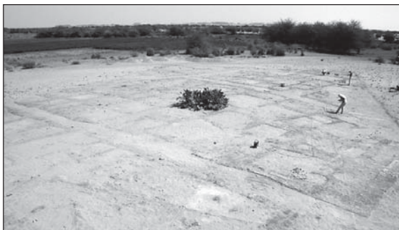
Abb. 2: Überblick über die freigelegten Siedlungsreste.

Etwa 1400 m 2 der untersuchten Fläche zeigten die fast vollständig erhaltenen Hausgrundrisse einer dichten Bebauung (Abb. 1-2, Farbabb. 4). Dabei befanden sich nicht nur die Mauern und Ziegel in einem sehr guten Erhaltungszustand. Selbst Details wie der Farbe tragende Lehmverputz waren noch vorhanden. Das Gebiet beherbergt vier annähernd rechtwinklig angelegte Gebäudeblocks, die voneinander durch enge Straßen von etwa 1 m Breite gegliedert sind. Die generelle Orientierung der Bauten entspricht derjenigen des Tempels H 1000. Der mittlere Block H 1200 bedeckt eine Fläche von rund 450 m 2 und hat ein Maßverhältnis von annähernd 1:2. 3) Vorspringende Mauerecken an einigen Außenmauern sowie der teilweise gewundene Verlauf der Straßen lassen es möglich erscheinen, dass die Bauten ursprünglich kleiner und planmäßiger angelegt waren und durch spätere