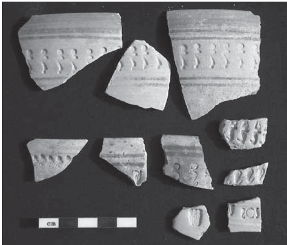
Abb. 7: Mit verschiedenen Uränenmustern verzierte Scherben.