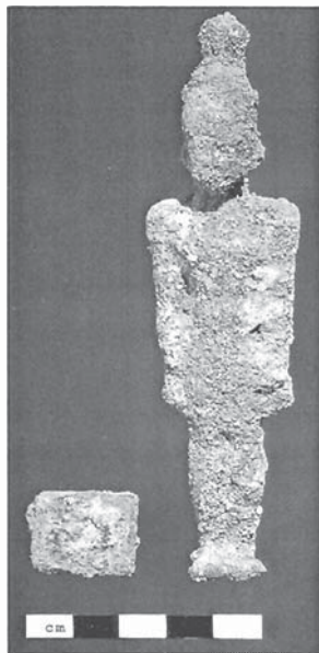
Abb. 1. Stark verunklärte Oberfläche, Zustand vor der Restaurierung.

Das Erscheinungsbild der Korrosion entsprach einem Zersetzungsprozess, der so in sandigen und lockeren Böden entsteht. Daraus geborgene Metallfunde bieten nicht selten einen unerfreulichen Anblick. In Verbindung mit einem hohen Korrosionsgrad lassen sich oft alle Korrosionserscheinungsformen nachweisen, die das Ergebnis des Zusammenwirkens verschiedener Faktoren sind. Das beschriebene sandige Umfeld besitzt im Verhältnis zu dichten lehmigen Böden große unregelmäßige Teilchen. Sie bilden aneinander gelagert ein poriges, netzartiges Gefüge aus. Innerhalb dieser Gefügestruktur entstehen Zwischenräume die sich mit weiteren kleinen Bodenpartikeln füllen (Salze, organische Verbindungen). Im Korrosionsprozeß spielen solche Anlagerungen eine