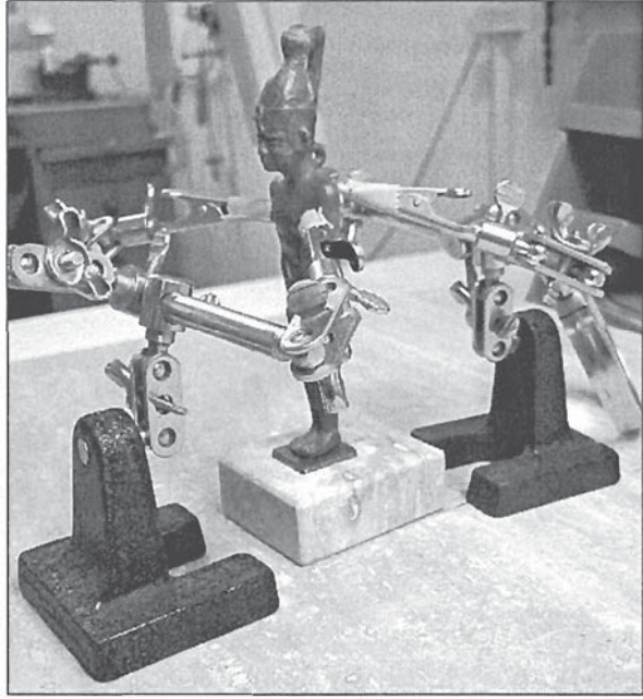
Abb. 3: Statuette beim Verkleben.

Eine unvollständige Abnahme der Konglomeratschicht vor Erreichen der originalen Oberfläche würde nicht zum gewünschten Ergebnis führen, ein Abtrag unter das beschriebene Niveau stellt eine Verletzung der Originalsubstanz dar und muß in jedem